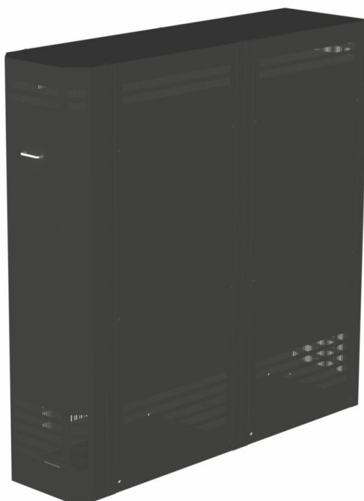
Сборка стеллажа СА-40-120 (МД) с соединением секций по узкой стороне