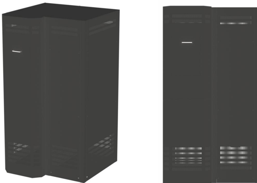
Сборка стеллажа СА-40-120 (МД) с соединением секций по широкой стороне